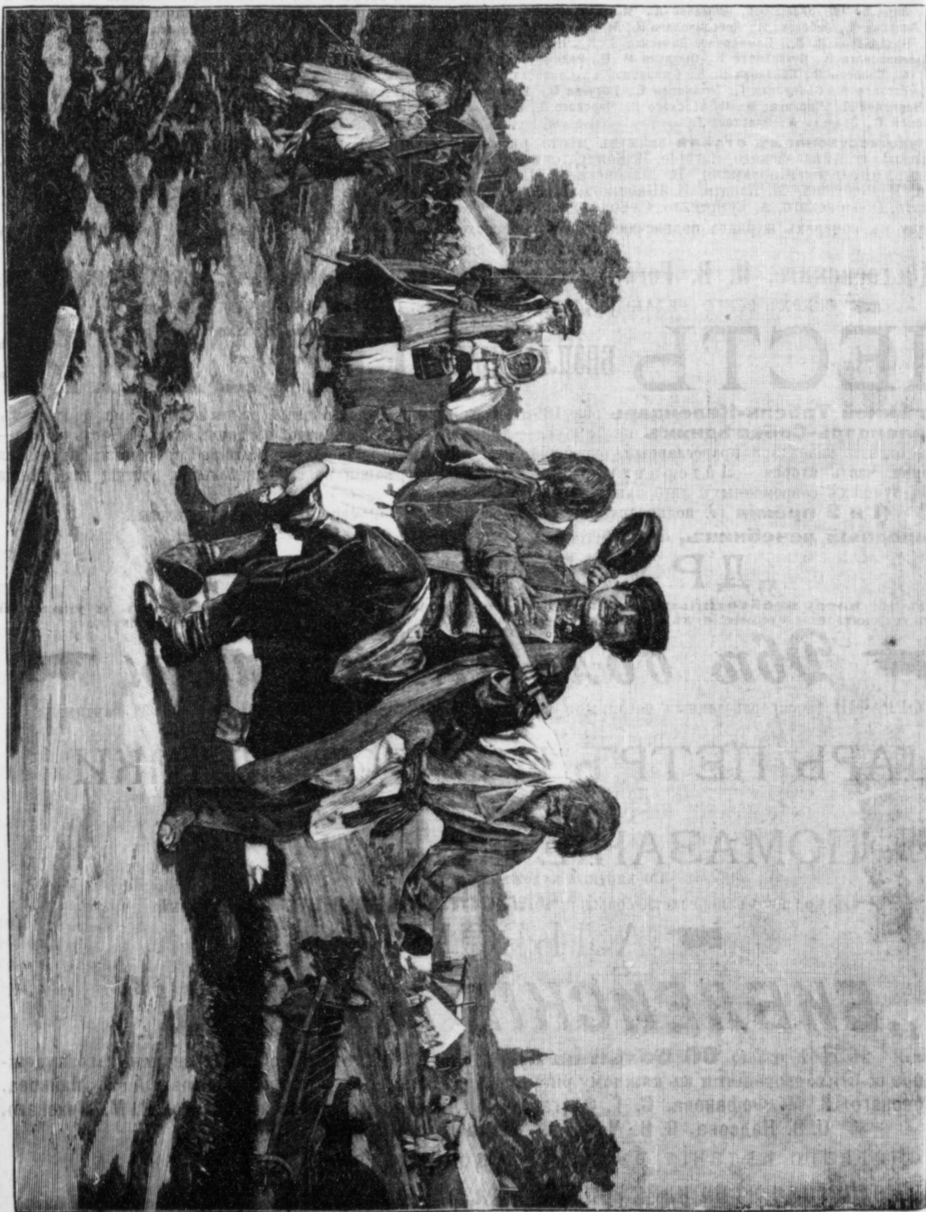
ВОЗВРАЩЕНІЕ СЪ ЯРМАРКИ. (Г. вилл. акд. Корзухинъ, „Родина“, 1893 г., № 14.)